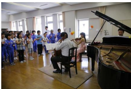
手話付きの合唱を披露してくれました