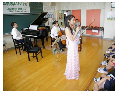
恭子さんから、みんなへ暖かいメッセージ