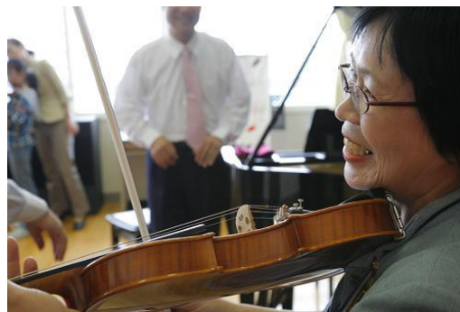
校長先生も一緒に ヴァイオリンに挑戦。