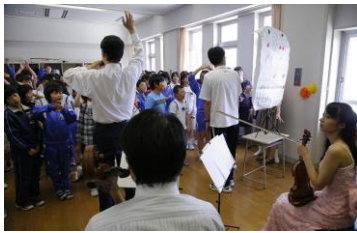
白熱! ボディパーカッション