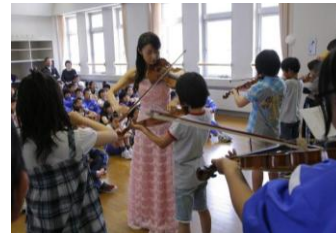
ヴァイオリンに挑戦中。みんな、がんばれ〜