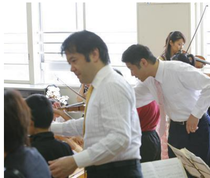
アーティスト指導の下、 一生懸命ヴァイオリンにむかいます。