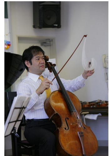
弓の白い部分の正体は・・・