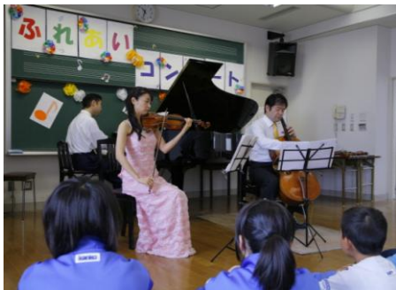
ふれあいコンサートの始まり!