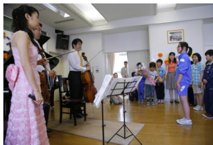
各学年の代表者からお礼の言葉と花束を頂きました