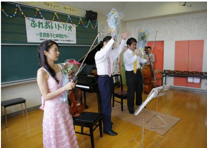
“ありがとうございました” 花束贈呈です。