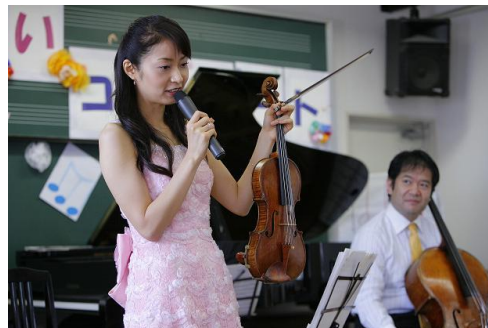
ヴァイオリンは何の木でできているかな?