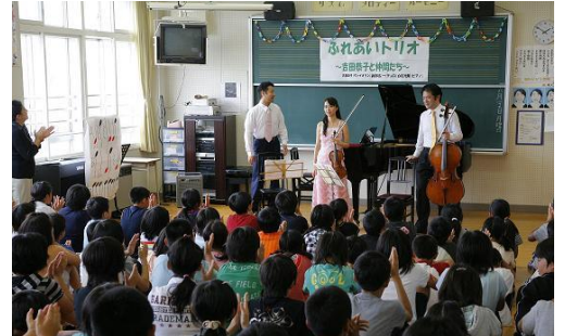
ふれあいトリオ登場！ コンサートの始まりです