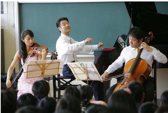
みんな集中し、耳をそばだてて聴いています。