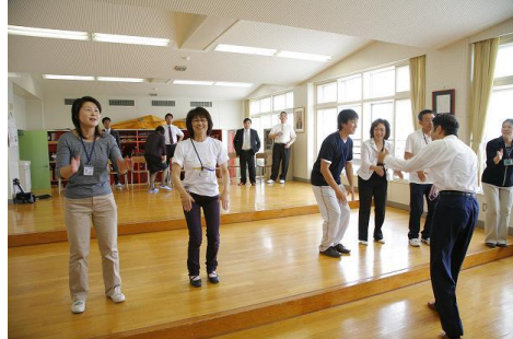
本番前。ボディパーカッションの練習に励む先生方