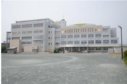
市民センターが併設している小学校

2009年6月29日(月)「ふれあいプログラム」No.273 10:30~11:40 青森市立古川小学校 音楽室(4階) 4、5、6年生 100名対象