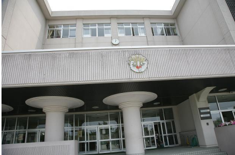
とても広い小学校

2009年6月29日(月)「ふれあいプログラム」No.274 13:50~15:00 青森市立浪打小学校 音楽室(4階) 5、6年生 110名対象